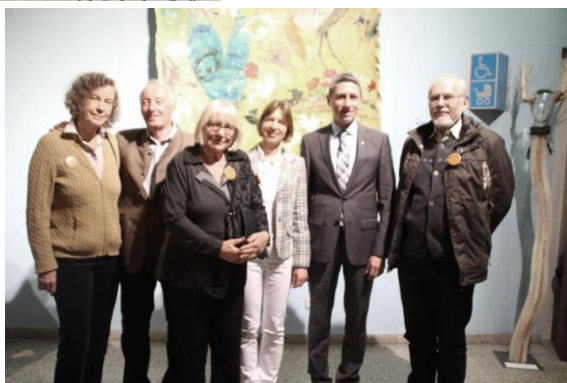
Lohhofer Anzeiger – 26.12.2015